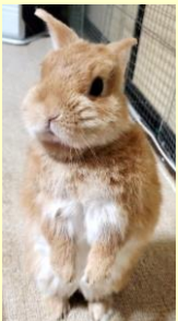
マスコットキャラ「ビョンくん」

行政書士の仕事と営業、システム関係を担当しているが、より重要なのは宴会の幹事。 東京生まれ牧区在住なのだが、セミナー講師の際に方言を多用するため東京生まれと言っても誰も信じない。